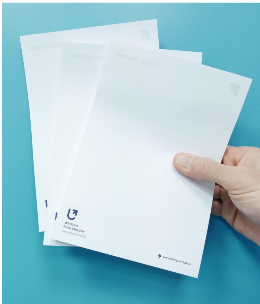
Notesy (format A5) Cena jednostkowa: 6,00 zł