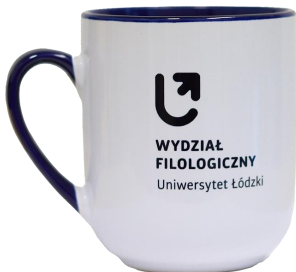
Kubek Combo – biały (290 ml) Cena jednostkowa: 15,00 zł