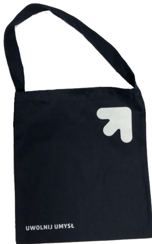
Torba materiałowa Cena jednostkowa: 17,00 zł