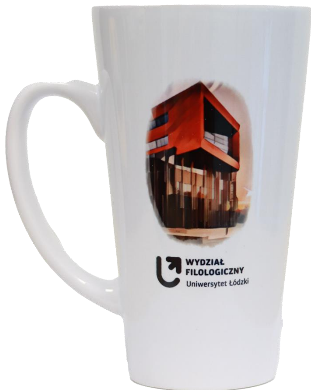
Kubek latte (450 ml) Cena jednostkowa: 20,00 zł