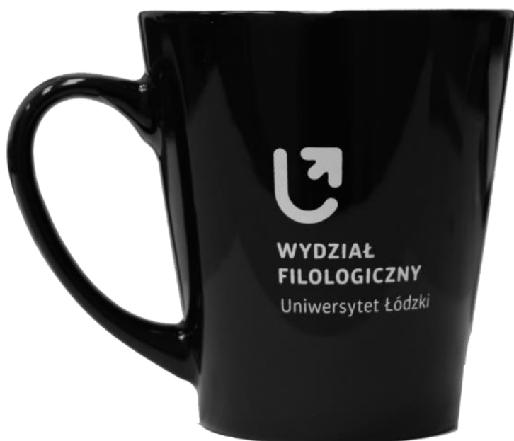
Kubek granatowy (350 ml) Cena jednostkowa: 25,00 zł